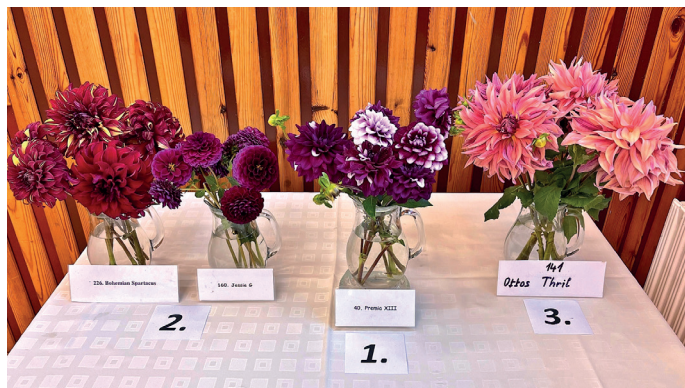
Jiřinky, které získaly nejvíce hlasů návštěvníků výstavy.

Druhou zastávkou našeho výletu bylo nejnavštěvovanější poutní místo na Moravě. Nedaleko Brna ve Křtinách jsme navštívili významnou památku barokní architektury, poutní místo s chrámem Panny Marie vybudovaném podle projektu Jana Blažeje Santiniho. Na hlavním oltáři je umístěna gotická socha Madony, která stála u počátku poutní tradice ve středověku. Jsou zde také 250 let staré