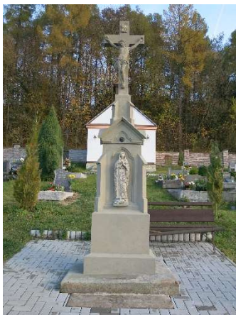
Stav po zrestaurování