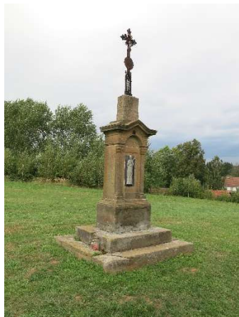
Stav před restaurováním