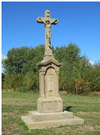
Stav po zrestaurování

V září roku 2016 svazek zpracoval a podal následující žádosti o poskytnutí dotace z rozpočtových prostředků Pardubického kraje v rámci Programu obnovy venkova: