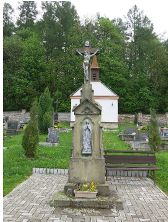
Stav před restaurováním