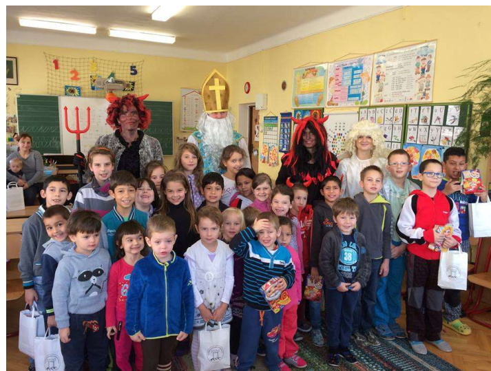
Děti z mateřské a základní školy v Cotkylti

Rok se překlopil do svého konce a zaměstnanci našeho CSS se za výpomoci starostů Dolní Čermné, Petrovic a Bystřece v tento tajemný čas proměnili v moudrého Mikuláše, dva hašteřivé čerty, vlídného anděla a rozjeli se s nadílkou pastelek, náčrtníků, ovoce a trochou laskomin ukrytou v papírových taštičkách za dětmi do mateřských a základních škol.