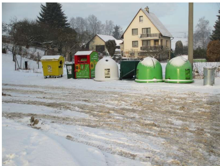
Ilustrační foto: nádoby na tříděný odpad v obci Horní Čermná